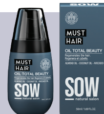
OIL TOTAL BEAUTY