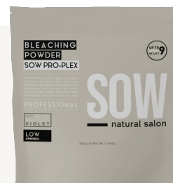
BLEACHING POWDER SOW PRO-PLEX

Aclara hasta 9 tonos. Acción rápida. Efecto anti-amarillo. No volátil.