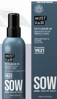
H2O LEAVE IN

Especialmente desarrollado para facilitar la rutina de cuidado del cabello. Con protección térmica que protege y reestructura el cabello, suaviza la cutícula y elimina el encrespamiento.